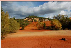
Le Colorado provençal - Rustrel

Entre le Parc du Luberon et le plateau d'Albion, vous allez traverser des paysages très divers, sauvages ou paisibles, colorés ou uniformes, avec des reliefs tantôt rudes ou plus doux...Des paysages qui vous enchanteront...si vous avez quelque peu d'entraînement!!