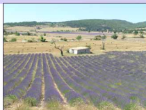
Champs de lavande à Ferrassières

C'est la "mini boucle", idéale pour un premier bon entraînement! Pour rejoindre Ferrassières, sur le Plateau d'Albion, on peut opter pour la voie relativement douce du Gour des Oules et Aurel, ou la voie plus raide de la Côte St Martin (belle montée de 4km depuis le départ et belles vues sur Montbrun et les monts environnants).