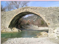
Pont au dessus du Toulourenc